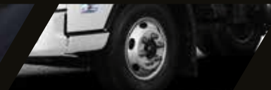
Frenos ABS + EBD