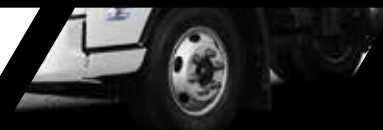
Frenos ABS + EBD