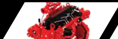
Motor Cummins ISF