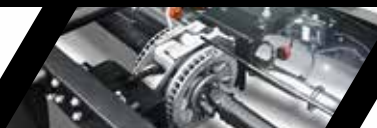
Freno de motor + Retardador