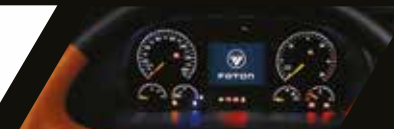
Panel de información