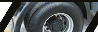
Eje con cubos reductores