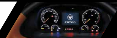
Panel de información